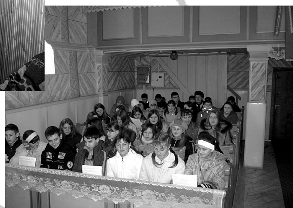
Ifjúsági csendesnap Tiszaujlakon

A lelkipásztorok szolgálatában nagyon fontosnak tartom azt, hogy imádkozva, együtt