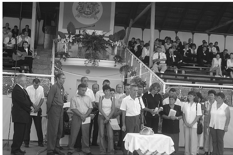
A Reformátusok Világtalálkozójának tiszapéterfalvi rendezvényén a gyógyultak bátran álltak a több ezres közönség elé, hogy hitet tegyenek Isten mellett, hogy üzenjenek mindenkinek: az Úrnál van a szabadulás...

a szenvedélybetegeknek, akik szabadulni szeretnének. Itt találkoztunk már tiszta és hitükben erősödni vágyókkal, meg olyanokkal, akik megpróbálják megtalálni az élet igazi értelmét, keresik a szabadulás útját, módját. Ebben itt igen nagy segítségük-