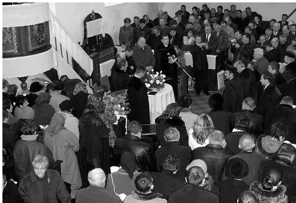
Az Ungi egyházmegye esperesének beiktatása. Eszény

Január 21-én magyarországi, erdélyi, partiumi, felvidéki, kárpátaljai egyházi vezetők, állami tisztségviselők jöttek el, hogy részt vegyenek az újonnan megválasztott kárpátaljai református zsinat tagjainak, tisztségviselőinek, püspökének ünnepélyes beiktatásán. Képviseltette magát szinte valamennyi kárpátaljai református gyülekezet, hogy együtt adjanak hálát Istennek, amiért mindaddig megtartott bennünket, s közösen imádkozzanak azért, hogy az újonnan megválasztott tisztségviselőknek adjon bölcseséget, hogy az Ige igazsága és a krisztusi szeretet vezérelje őket szolgálatukban.