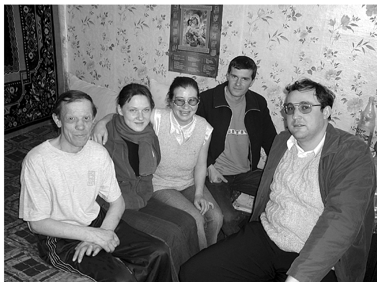
Kárpátaljaiak a kucsurgáni lepratelep betegek körében

meghozta gyümölcseit. A munkatársak kérésére és meghívására a betegek elmennek azokra az evangelizációs alkalmakra, melyeket