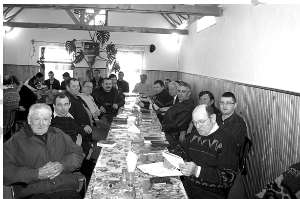
Presbiteri csendeshét Tivadafalván

Mindenképpen fontosnak tartom, hogy az egyházunkban helyreálljon a törvényes rend. Az egyház zsinata által hozott határozatokat tartsuk be, a sákrantumokat helyesen szolgáljuk ki. Ötven év mulasztását kell pótolnunk a hitoktatás, konfirmáció-oktatás terén, el kell indítani a felnőtt konfirmáció-oktatást ott,