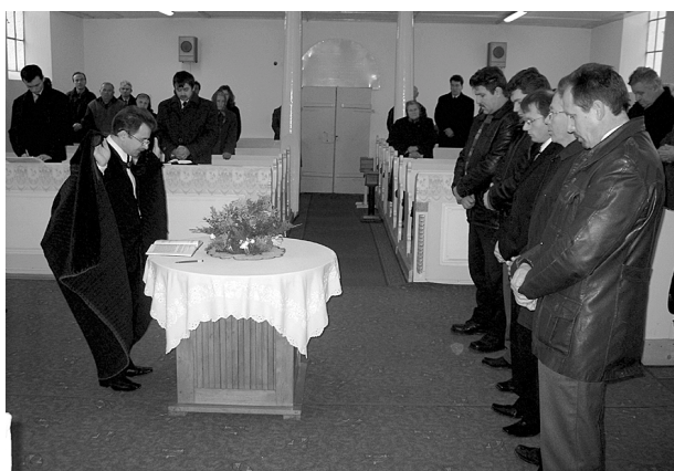
Tisztségviselők beiktatása a tivadarfalvi református gyülekezetben

1Pét2,9: „Ti pedig választott nemzetiség, királyi papság, szent nemzet, megtartásra való négyetek, hogy hirdessétek Annak hatalmas dolgait, aki a sötétségből az ő csodálatos világosságára hívott el titeket.”